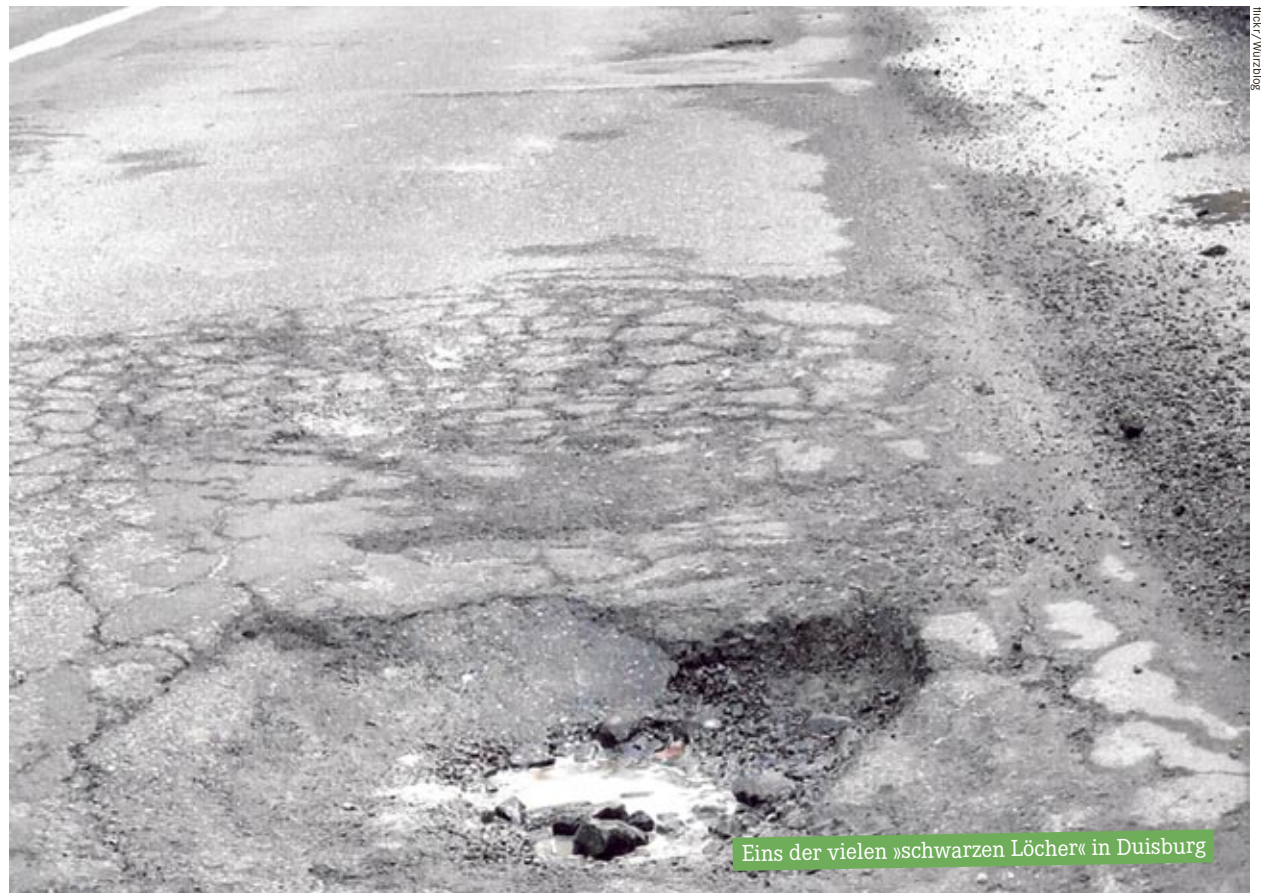
Eins der vielen »schwarzen Löcher« in Duisburg

Jetzt wird im Gegenzug zu den Landeshilfen ein verbindlicher Sanierungsplan verlangt, der binnen 5 Jahren den Haushaltsausgleich erreicht. Dieser muss bis zum 30.6.2012 der Kommunalaufsicht vorgelegt werden. Für den Duisburger Haushalt wird für 2012 und die Folgejahre ein deutlicher Rückgang der Fehlbeträge durch die von SPD, Grünen und LINKEN beschlossene mittelfristige Finanzplanung 2010 und 2011 erwartet. Aber noch ist mit einem Minus von 198 Mio. € in 2012 zu rechnen. Dieses muss nun mit den Landeshilfen und durch eigene Anstrengungen (Kürzungen, Streichungen, höhere Einnahmen usw.) abgebaut werden, die