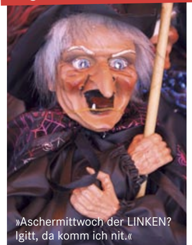
»Aschermittwoch der LINKEN? Igitt, da komm ich nit.«

Linker Aschermittwoch der LINKEN am 22.02.2012 in Kaßlerfeld. Mit Sahra Wagenknecht. » Rückseite